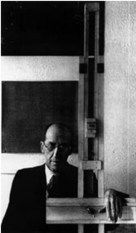
Fotoportrett av Mondrian