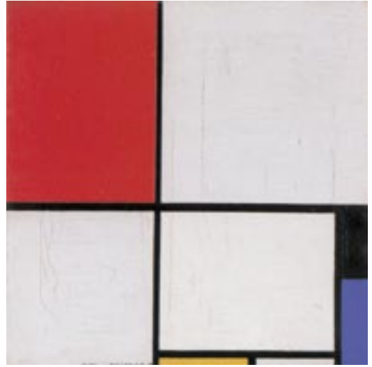
Composition with Red, Yellow and Blue, 1928. (c) Piet Mondrian/BONO 2004